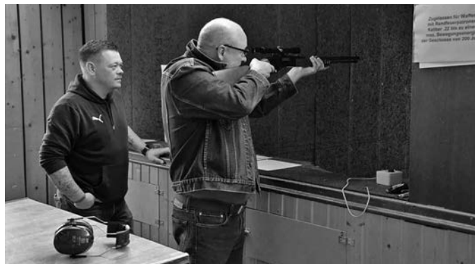
Ostereierschießen auf unserem 50m Schiessstand mit dem Winchester – Unterhebelrepetierer

Wie jedes Jahr hatte unser Schützenverein am Palmsonntag zum Ostereierschießen ins Schützenhaus eingeladen. Zu diesem Highlight in der Vor-Osterzeit konnten wir auch dieses Mal wieder zahlreiche Gäste von Klein bis Groß begrüßen. Wie gewohnt konnte die Jagd auf die Ostereier mit Blasrohr, Luftgewehr und KK-Sportpistole ab 13.30 Uhr beginnen und unsere Schießsport begeisterten Gäste ließen nicht lange auf sich warten. Zusätzlich konnten wir in diesem Jahr auch das Lichtgewehr auf eine Distanz von 10m für die kleinsten und den Winchester Unterhebelrepetierer auf eine Distanz von 50m für die größeren Schützen anbieten. Diese beiden neuen Disziplinen wurden auf Anhieb mit großem Zuspruch von den Teilnehmern angenommen, wir werden diese deshalb in unser Standardprogramm zum Ostereierschießen mit aufnehmen. Der Nachmittag nahm seinen Lauf und auch unsere Gastwirtschaft füllte sich recht schnell. Die Kuchentheke leerte sich zusehends und bei guter Laune, Kaffee, Kaltgetränken und belegten Brötchen entwickelten sich wie immer Geselligkeit und gute Gespräche. Alles in allem war es ein sehr schöner und kurzweiliger Nachmittag für die Gäste und unseren Verein. Zu unserer Freude konnten von den teilnehmenden Schützen wieder knapp 850 Eier erbeutet werden, allen Gästen herzlichen Dank dafür! An dieser Stelle auch ein Dankeschön an die zahlreichen Helfer, ohne die diese Veranstaltung nicht gestemmt werden könnte.