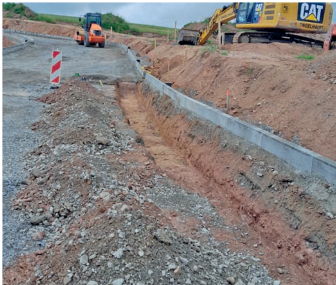
Abb.: Vorbereitungen zum Verlegen der Versorger-Infrastruktur

Aktuelle Bauarbeiten/Mitteilungen: Ausbau der Versorger-Infrastruktur