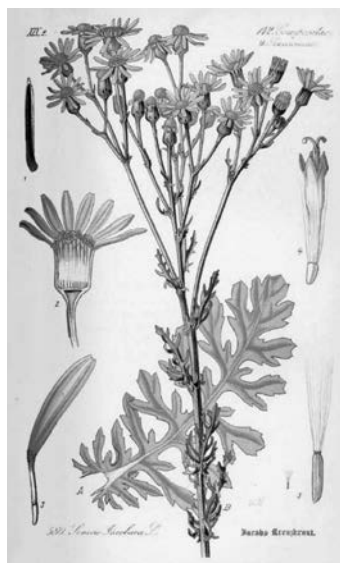
Abbildung 1 Jacobs-Kreuzkraut, Bildertafel aus Thome (1885) www.BioLib.de

- WICHTIGE INFORMATION FÜR FLÄCHENEIGENTÜMER - EIGENINITIATIVE IST GEFRAGT!