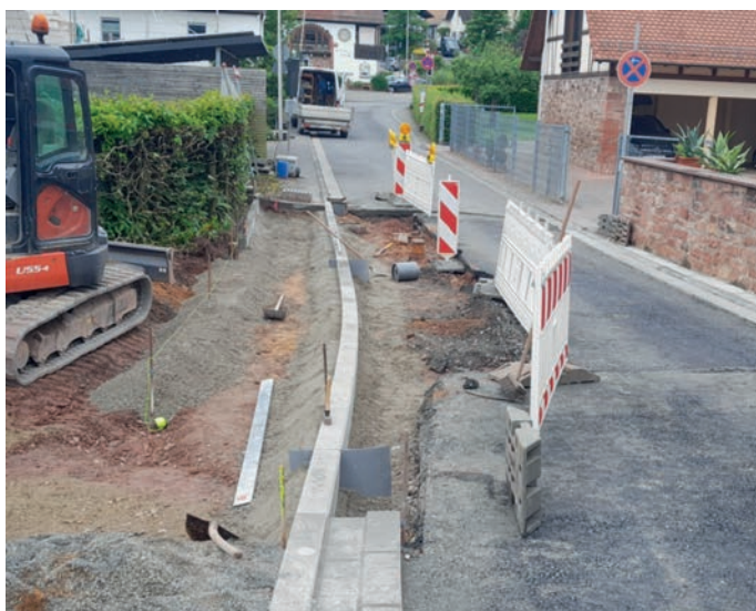
Abb.: Arbeiten am neuen Gehweg

Aktuelle Bauarbeiten/Mitteilungen: Pflaster- und Asphaltarbeiten