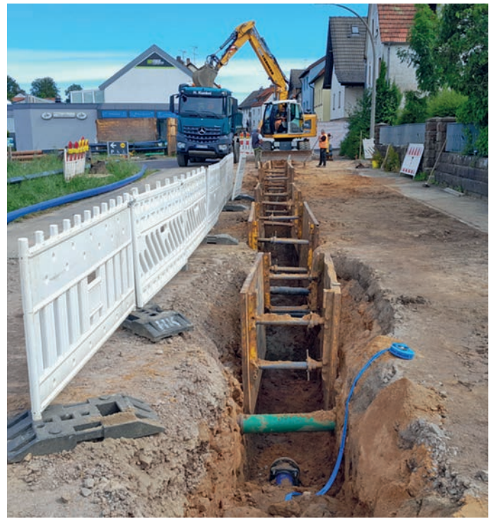
Abb.: Verlegung der neuen Wasserleitung