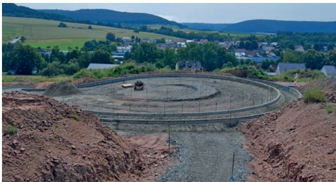
Abb.: Absteckung Wendehammer

Aktuelle Bauarbeiten/Mitteilungen: Setzen von Bordsteinen und Straßenrinnen