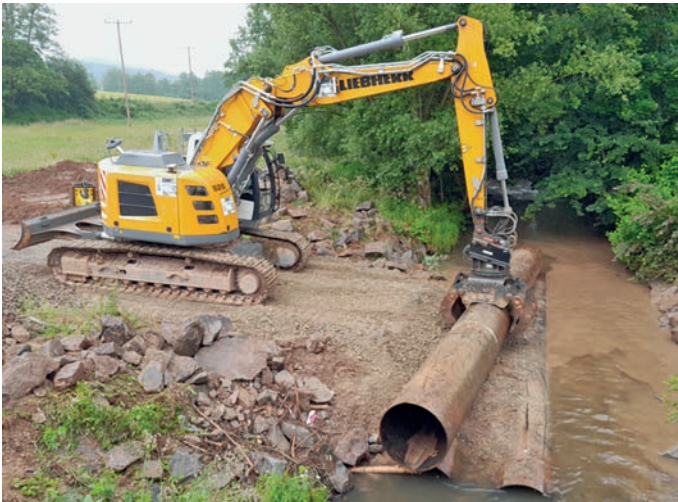
Abb.: Rückbau der bauzeitlichen Bachverrohrung

Aktuelle Bauarbeiten/Mitteilungen: Das Brückenbauwerk, als auch alle Verkehrsflächen im Ausbaubereich sind fertiggestellt. Aktuell offen sind arbeiten am neuen Brückengeländer. Eine provisorische Sicherung des absturzgefährdeten Bereiches wurde seitens der ausführenden Baufirma eingerichtet.