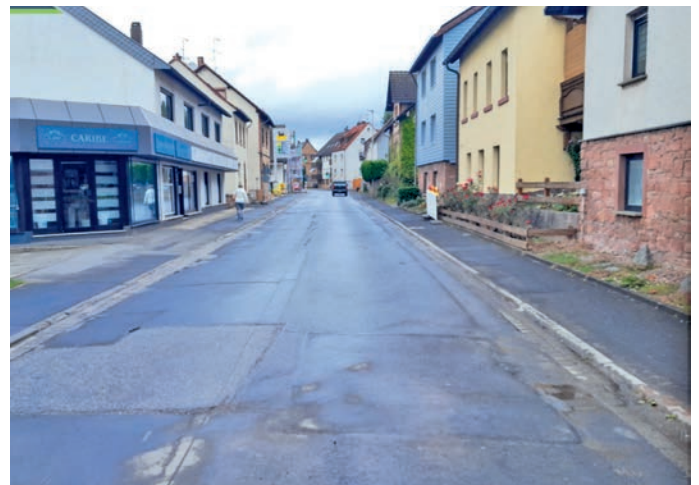
Abb.: Bauabschnitt 3