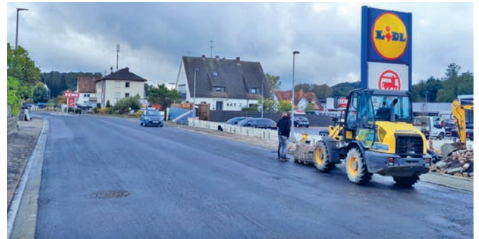
Abb.: Restarbeiten am Gehweg BA2

Die Arbeiten im Bauabschnitt 2 werden KW41 abgeschlossen. Der vorgegebene Bauzeitenplan konnte eingehalten werden.