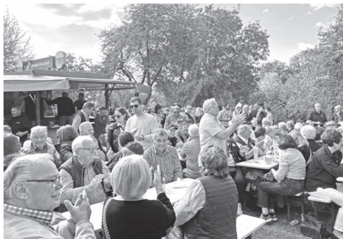
Zahlreiche Besucher feierten in der Edelweißhütte die Kerb.