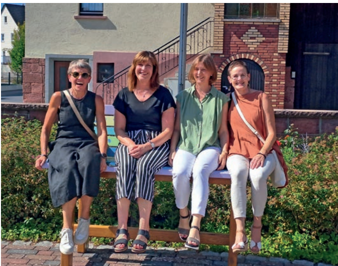
Probesitzen des kirchlichen Gemeindeteams

Damit uns die Bambelbank möglichst langer erfreut, wird sie über die Wintermonate trocken eingelagert.