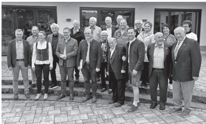
Das Gruppenfoto zeigt die langjährigen Mitgliederinnen und Mitglieder nach der Ehrung.