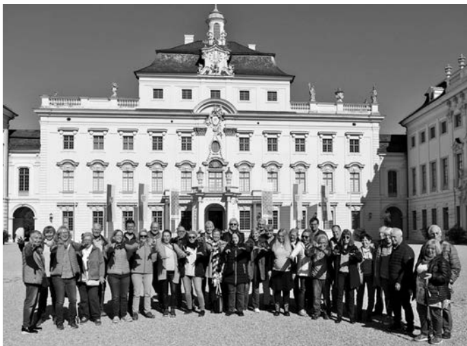
Die Reisegruppe aus Großkahl vor dem Ludwigsburger Schloss

Bei einer Einkehr im Trennfelder Gasthaus „Zur Sonne“ ließen die Sängerinnen und Sänger schließlich einen erlebnis- und lehrreichen Herbsttag im „Blühenden Barock“ ausklingen. Und von nun an denken die Großkahler beim Stichwort „Barock“ bestimmt immer auch an Kürbisse.